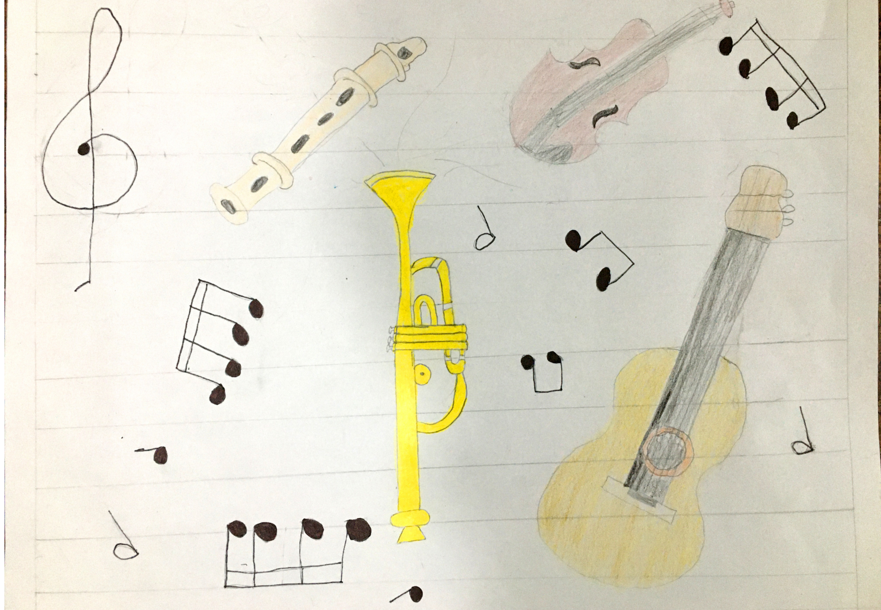
ILUSTRACIÓN: JULIA HERNÁNDEZ MARTÍNEZ