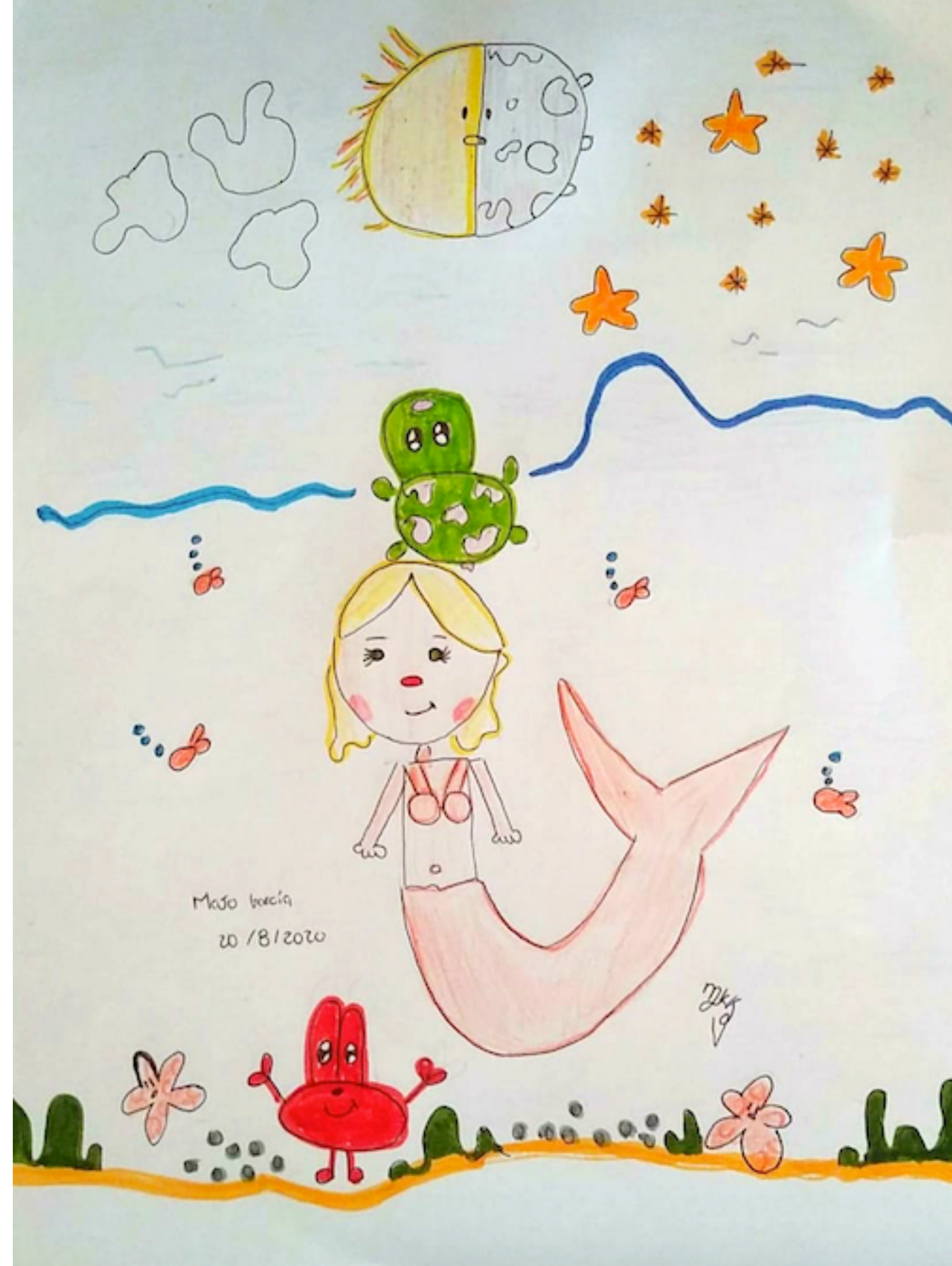
ILUSTRACIÓN: MAJO GARCÍA