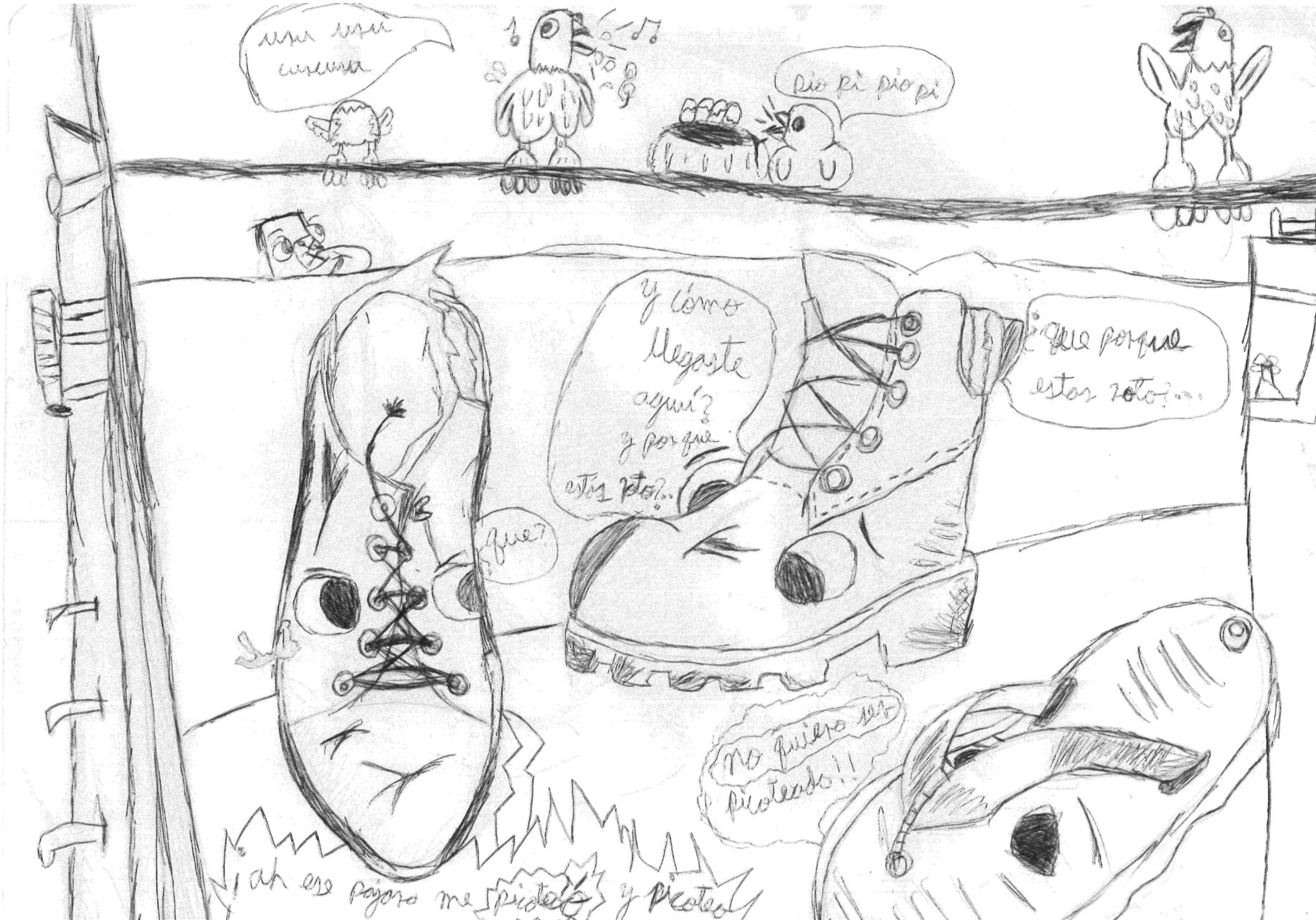
ILUSTRACIÓN: BRUNO MARTÍNEZ ROBLES