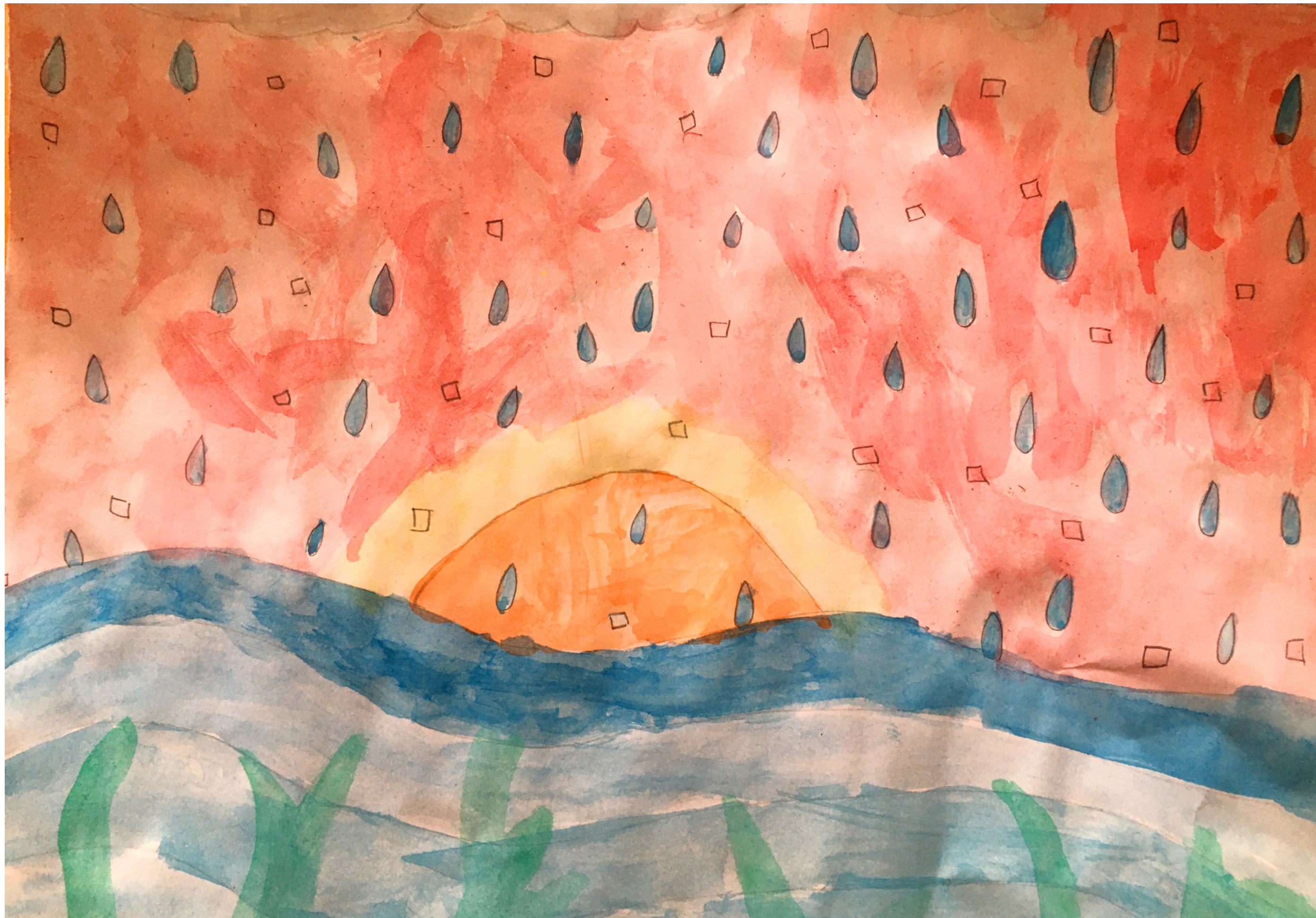
ILUSTRACIÓN: JULIA HERNÁNDEZ MARTÍNEZ