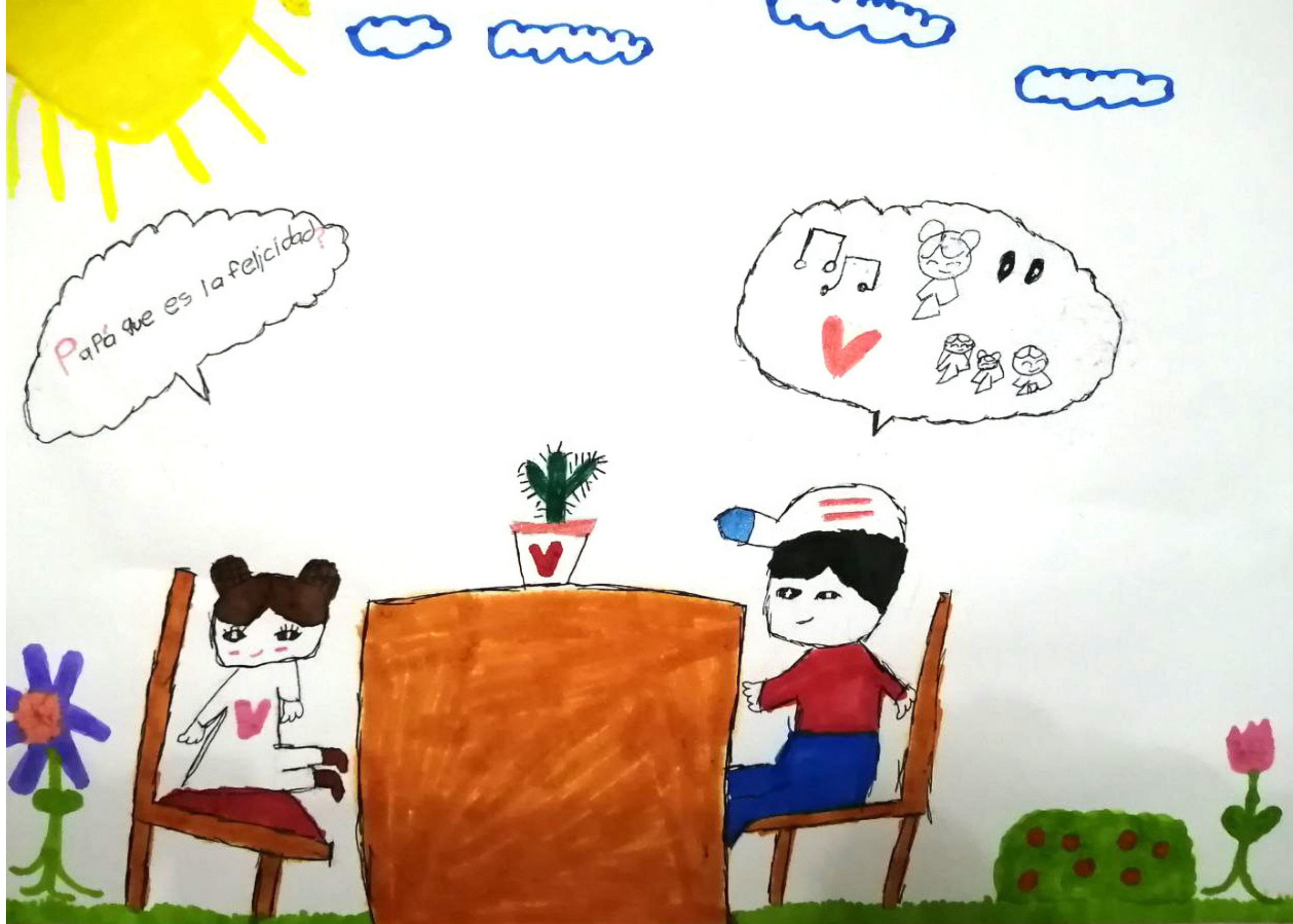
ILUSTRACIÓN: MARÍA FERNANDA FLORES ALBARRÁN