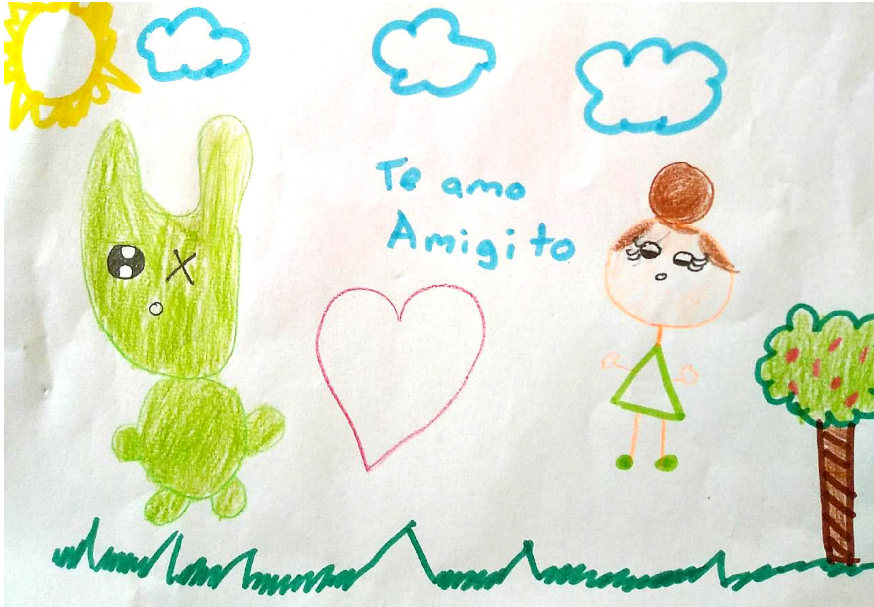
ILUSTRACIÓN: PAULINA GARCÍA